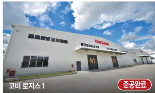
코비 로지스 1