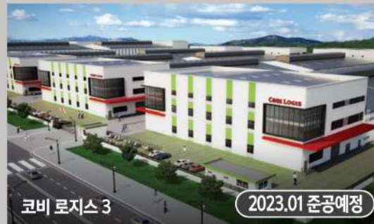
코비 로지스 3