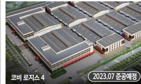
코비 로지스 4

* 코비 로지스 4 현장사진 “코비로지스 4는 고객의 요구에 맞게 시공됩니다.”